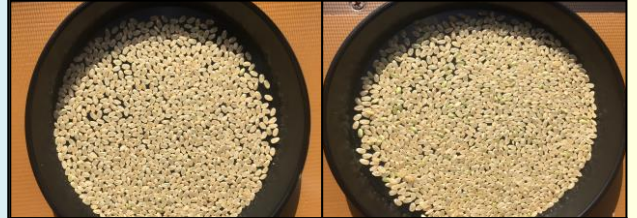
コシヒカリ(左)とこしいぶき(右)をカルトンにのせた様子