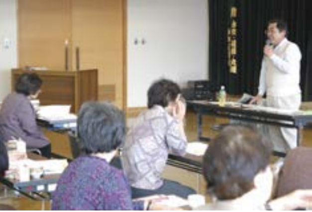
園芸品目の栽培講習を受ける女性部員

一人ひとりの生産量は少なくても、多くの生産者が集まれば、給食（学校・佐渡病院）への納品や直売、各イベントへの出店によって佐渡産野菜の生産拡大に結びつける事ができ、農産物の生産拡大と農業所得向上につながると考えています。