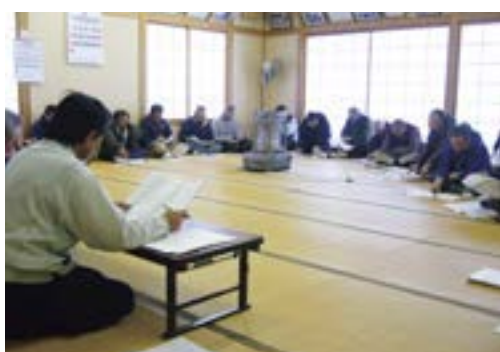
J A からの説明を聞く参加者