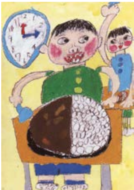
「うれしいカレーの日」

平成23年度(第36回)「ごはん・お米とわたし」 作文・図画コンクール入賞作品より