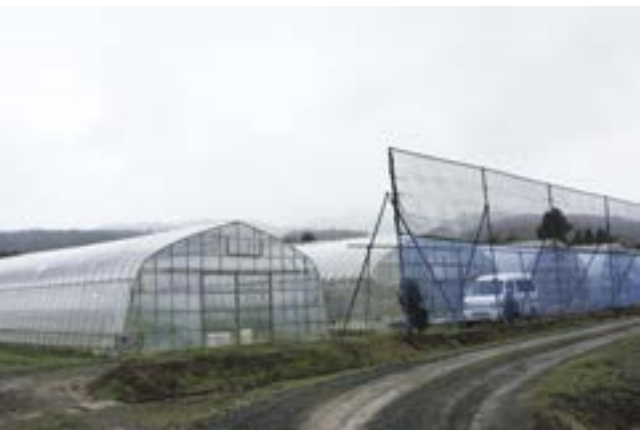
園芸品目の導入で、育苗ハウスを通年活用している