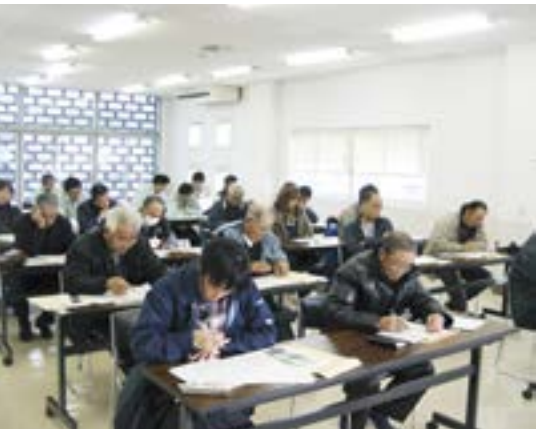
「養液土耕栽培システム」研修会を開催

平成24年度には、2生産組織が取り組む予定です。販路についても、現在市場と連携しながら、量販店への納入システムの構築を図っています。