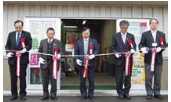
オープン初日には式典とテープカットを行った