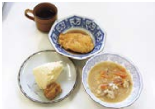
とろろの袋煮・とろろだんご鍋・米粉で作る蒸しパン

レシピは①とろろの袋煮 ②とろろだんご鍋 ③米粉で作る蒸しパンの3種類で、試食した参加者からは「野菜たっぷり、高齢者から子どもまでおいしく食べられる。自宅でも作ってみたい」と好評でした。