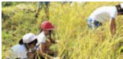
行谷小学校：稲刈り体験

9月28日、5年生13名が稲刈り体験をしました。刈り方の説明を受け、1株ずつ丁寧に刈り取り、はざ掛け用の束の作り方を教えて貰い実際に1束作りしました。後半はコンバインに乗り刈り取り体験をしました。