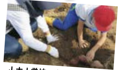
小木小学校：さつまいも掘り

9月28日、児童が稲刈り体験をしました。JA営農指導員から刈り方の説明を受け、地域の皆さんと一緒に怪我に十分注意しながら一生懸命稲刈りをしました。