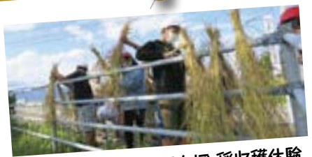
河崎小学校：ミニ田んぼ 稲収穫体験

9月28日、5年生13名が稲刈り体験をしました。刈り方の説明を受け、1株ずつ丁寧に刈り取り、はざ掛け用の束の作り方を教えて貰い実際に1束作りしました。後半はコンバインに乗り刈り取り体験をしました。