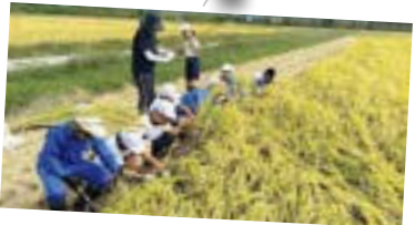
八幡小学校：稲刈り体験

10月1日、5年生が発泡スチロールで作ったミニ田んぼの稲を収穫しました。収穫体験の前に事前学習で学んだことを活かし、ケガに注意しながら1人1株の稲を収穫し、刈り取った稲をはざ掛け用にわらで縛りはざ掛けを行いました。収穫後は脱穀、精米をして実食する予定です。