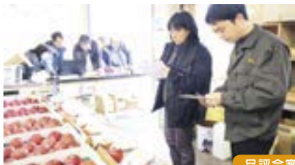
品評会審査の様子

よらんか舎では3月頃まで様々なりんごが出荷されています！ぜひお買い求めください。