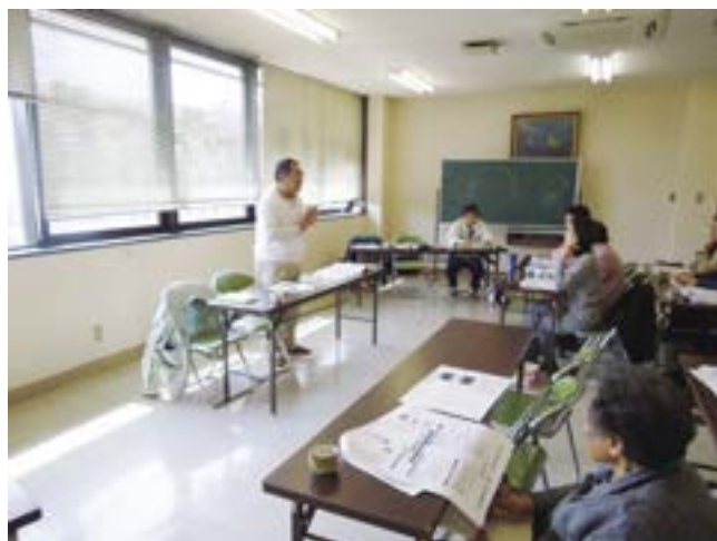
赤泊地区での提案会の様子

提案会では園芸振興チーム担当者が園芸の楽しさや直売所の魅力について講演し、多くの方から参加していただきました。