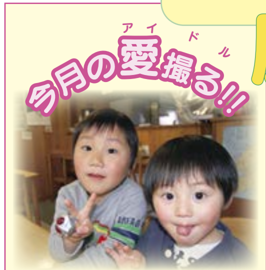
新穂支店管内（新穂潟上）