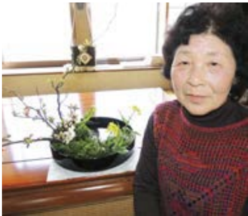
真野支店管内（四日町）