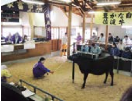
高値取引となった高千家畜市場