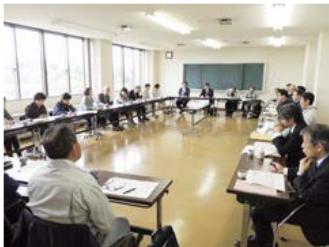
委員からは様々な意見・要望があがった