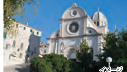
世界遺産 シベニク

街の起源は11世紀まで遡れるというクロアチア的首都。旧市街には古き良きヨーロッパの面影が色濃く残っています。