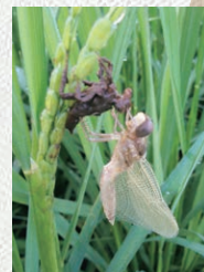
圃場で羽化している赤トンボ ※2