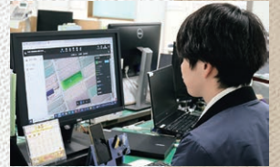
ザルビオを確認するJA佐渡職員

JA佐渡では本システムから多くの圃場の状況を把握することが出来るため、米の品質向上や営農計画の判断材料として水稻指導にも活用していきたいと考えています。