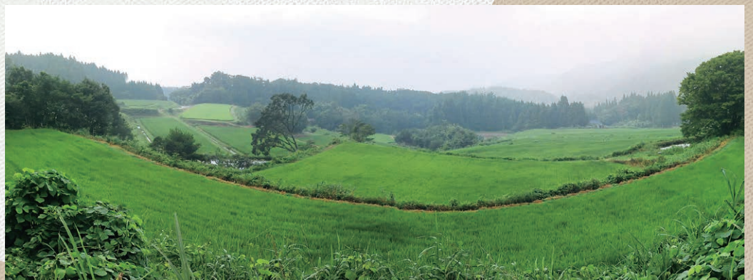
朝霧が晴れると弥彦山が臨める棚田 ※4