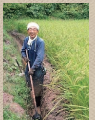
江のそうじの様子 ※3