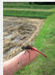
指に止まる赤トンボ ※1