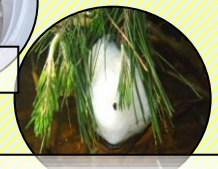
モリアオガエルの卵