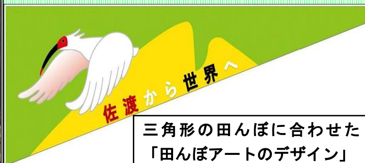
三角形の田んぼに合わせた「田んぼアートのデザイン」

昨年より取り組んでいる田んぼアートのデザインが、ついに決定しました。本年選ばれたデザインはトキの絵柄や世界遺産登録を目指している佐渡金山をモチーフとした絵柄の入ったものになりました。