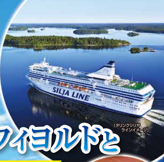
(タリンクシリヤ ラインイメージ)