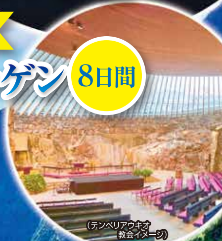
(テンベリアウキオ 教会イメージ)