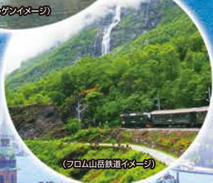
(フロム山岳鉄道イメージ)