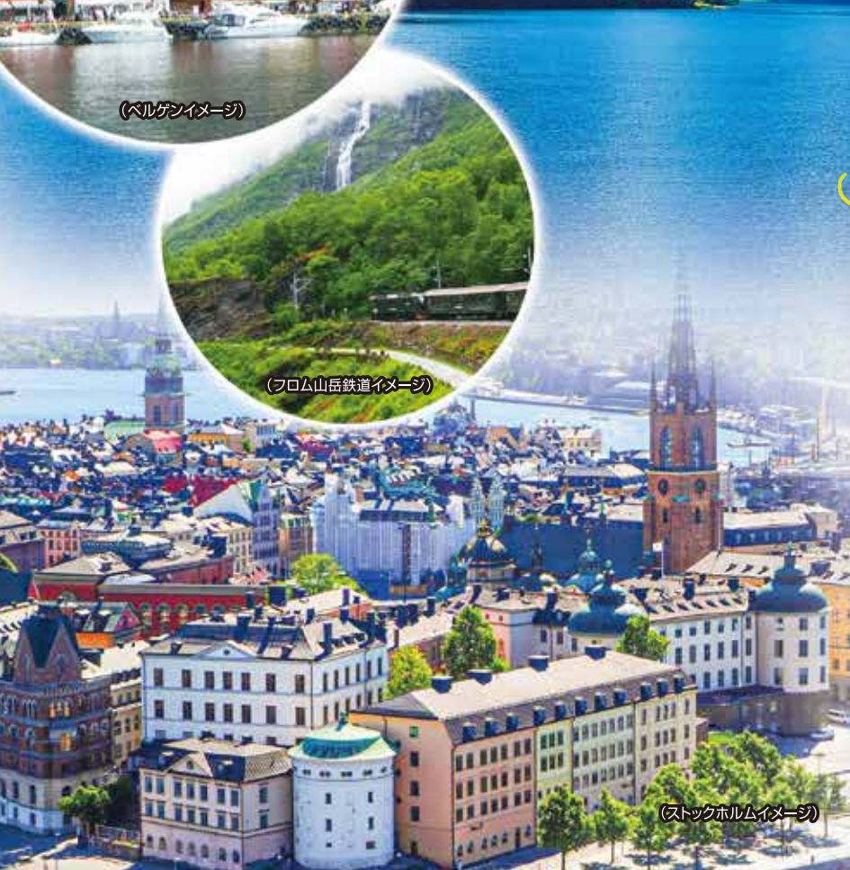
(ストックホルムイメージ)